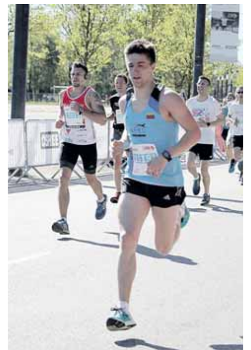
Domas maratono trasoje