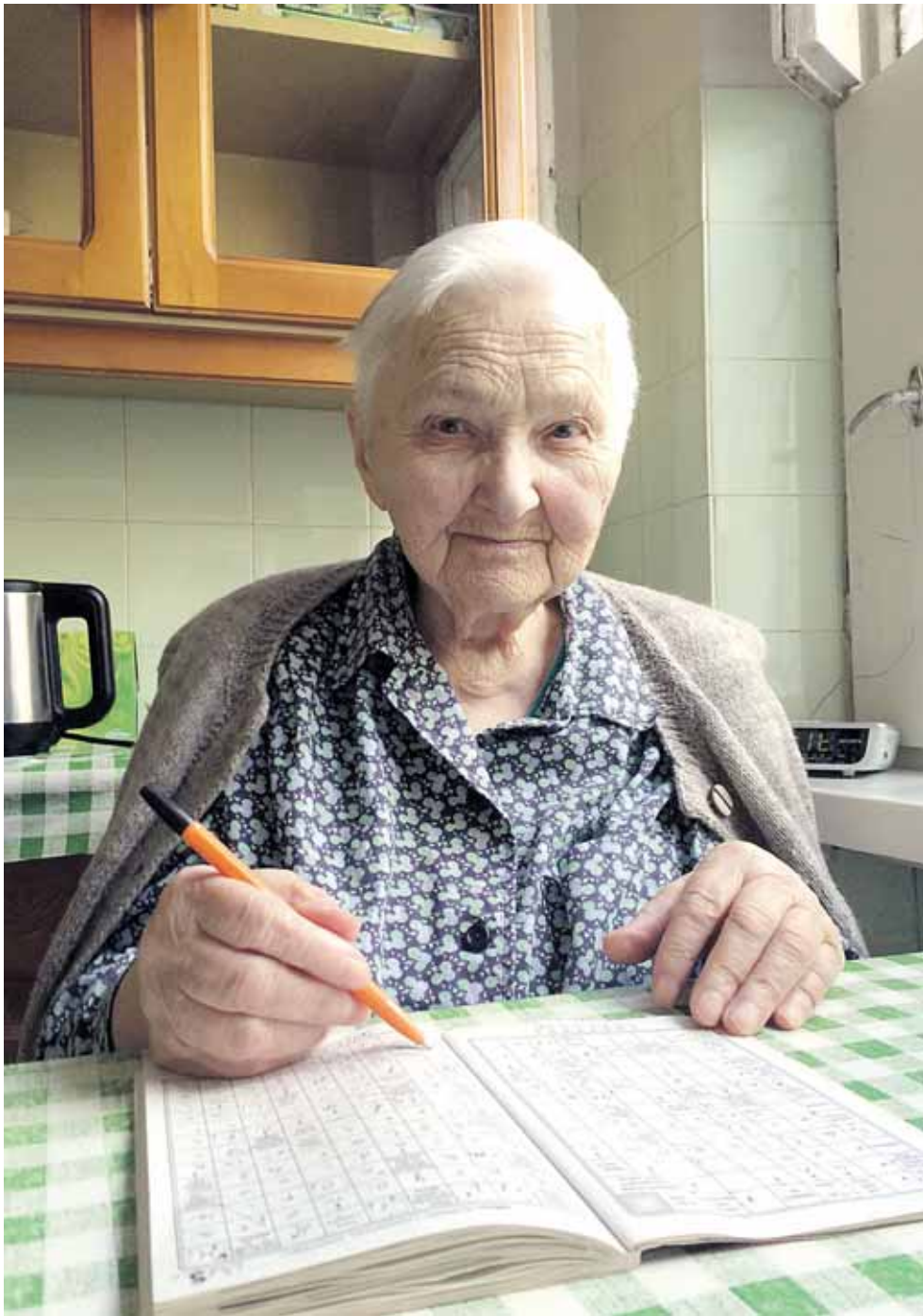
A.Lesevičienės pomėgis - spręsti kryžiažodžius