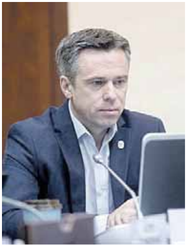
Vilius Semeška Domanto Pipo nuotr., www.delfi.lt