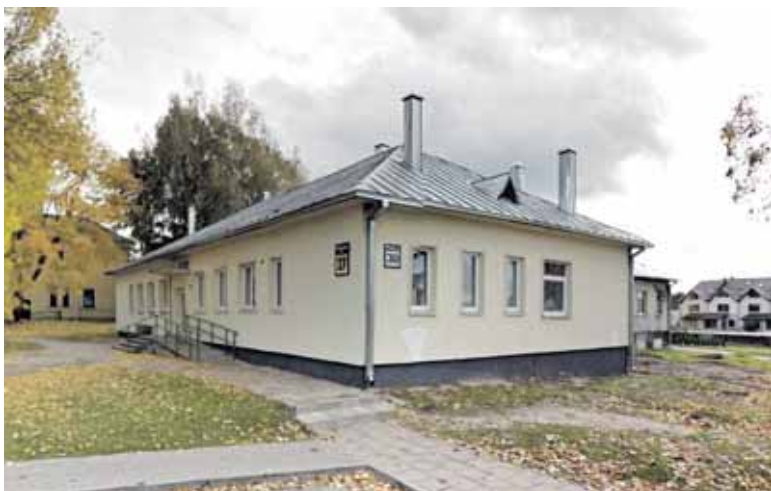
Valdžia amatų centrą atidarė buvusios miesto pirties pastate, kurio renovacijai išleista beveik 853 tūkst. eurų