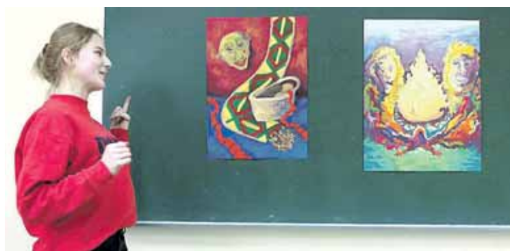
Olimpiados nugalėtoja Ugnė Janeliauskaitė su savo piešiniais

Ugnė atstovaus Druskininkams dailės olimpiadoje