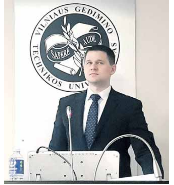
Besiginant mokslų daktaro disertaciją