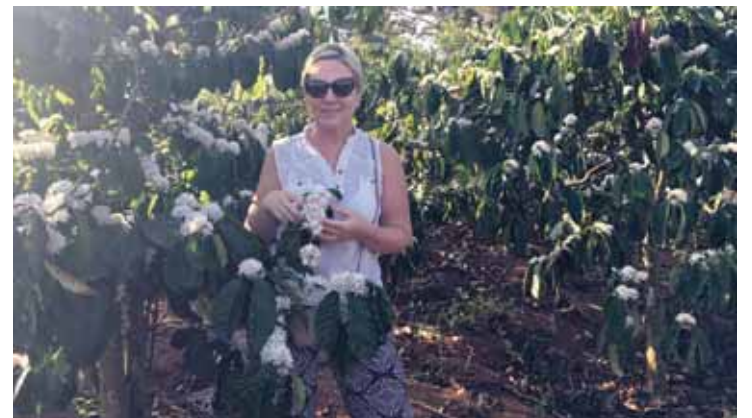
Ponia Rasa tarp žydinčių kavamedžių