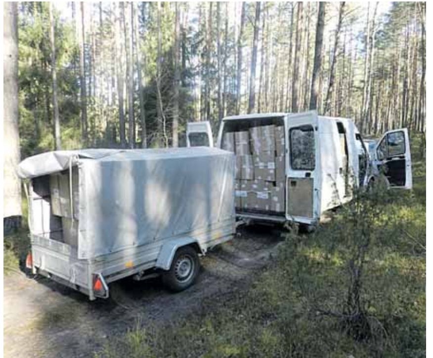
Kontrabandos sulaikymas