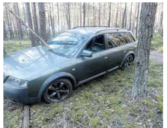
Kontrabandos sulaikymas