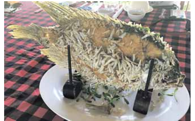
Paragauti - įvairi jūros gėrybių pasiūla