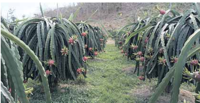
Drakono vaisių plantacija