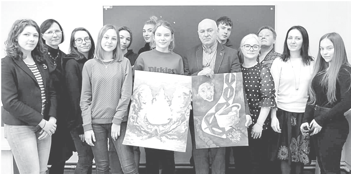
Olimpiados dalyviai su vertinimo komisijos nariais

K ovo 2 d. Druskininkų švietimo centre vyksa savivaldybės 8-11 klasių mokinių dailės olimpiados 2-asis etapas, kuriame dalyva-