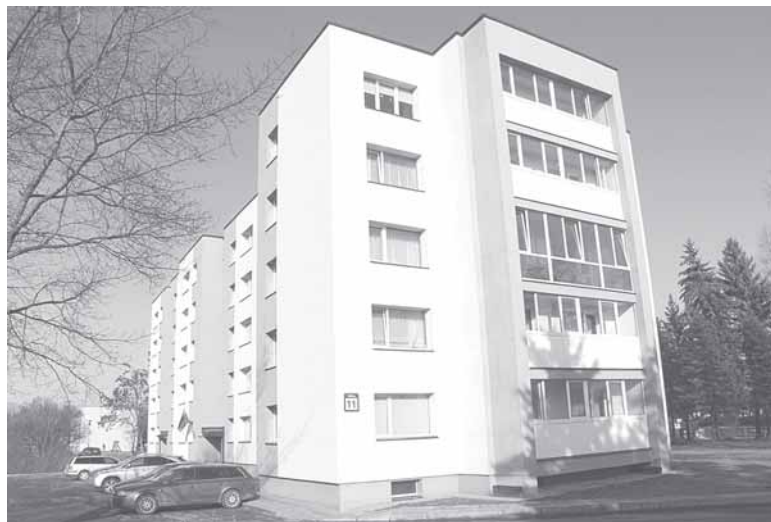
Daugiabučio gyvenamojo namo Seirijų g. 11 Leipalingyje 31-ame bute balkono remo apatinė dalis su nepermatomu užpildu yra gerokai aukštesnė nei kambario palangė, todėl kambaryje yra tamsoka

„Druskonio“ skaitytojų iniciatyva vėl tęsiam renovacijos tema. Neseniai 80-ies metų druskininkietė pensionkė savo straipsnelyje „Renovacija sujaukė senatvę“ viešai klausė, ar gyvenamųjų namų fasadų šiluminis putoplasto plokštėmis nėra kenksmingas sveikatai? Ar renovuojant Druskininkų daugiabučius buvo ištirta, kiek toksiškos yra putoplasto plokštės? Kodėl kokybiškų plytų gyvenamuosius namus būtinai reikia dengti putoplastu, jei šiluma butuose padidėja vien tik tinkamai sutvarkius balkonus, langus, pamatus ir stogus?