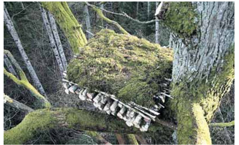
Juodojo gandro lizdas, įrengtas su samanomis