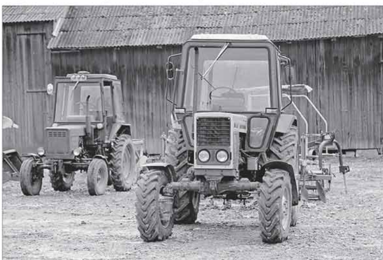
Šiuo metu vykstantis paraiškų priėmimo etapas „Parama smulkiesiems ūkiams“ išskirtinis tuo, jog ūkininkai gali pretenduoti įsigyti ne tik naują, bet ir naudotą žemės ūkio techniką.

Vienas iš Lietuvos kaimo plėtrios 2014–2020 m. programos (KPP) tikslų – remiant smulkiosius ir vidutinius ūkius pasiekti, kad jie ne tik galėtų išsilaikyti kintančioje rinkoje, bet ir būtų konkurencingi. Šiemet į paramą pagal KPP priemonės „Ūkio ir verslo plėtra“ veiklos sritį „Parama smulkiesiems ūkiams“ pareiškėjai gali pretenduoti net du kartus per metus. Pirmasis paraiškų priėmimas prasidėjo kovo 1 d. ir tęsis iki gegužės 31 d. Šiam paraiškų priėmimo etapui skirta 10 mln. Eur paramos lėšų. Taigi, paramą galės gauti daugiau pareiškėjų nei anksčiau.