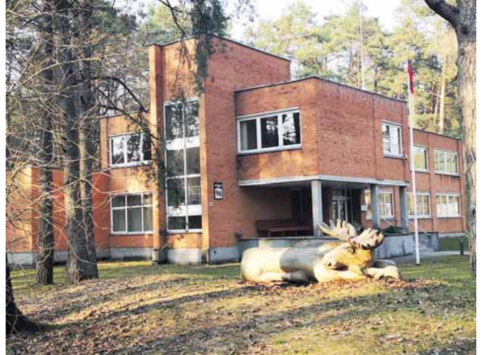
Buvusios Druskininkų urėdijos administracinė pastatė M.K.Čiurlionio g. 96 šikūrusios Druskininkų, Kabelių ir Baltašišės girininkijų būstinės