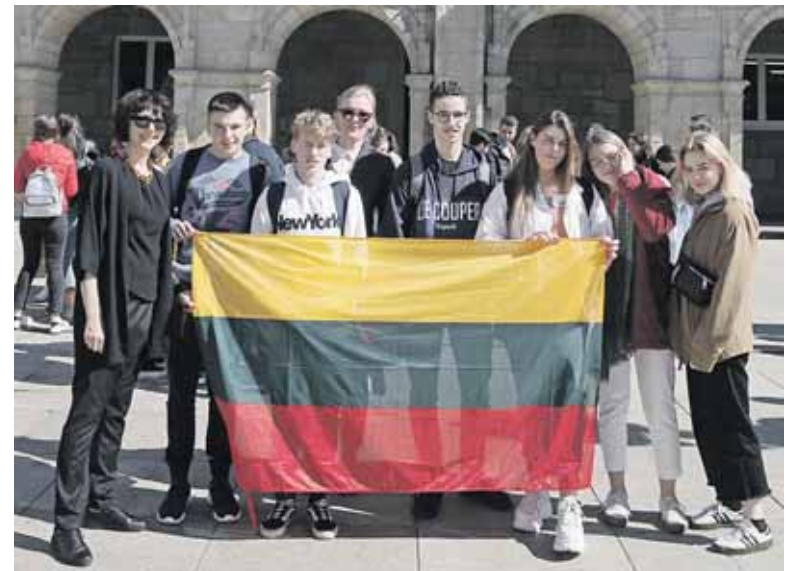
Prie Lugo miesto rotušės