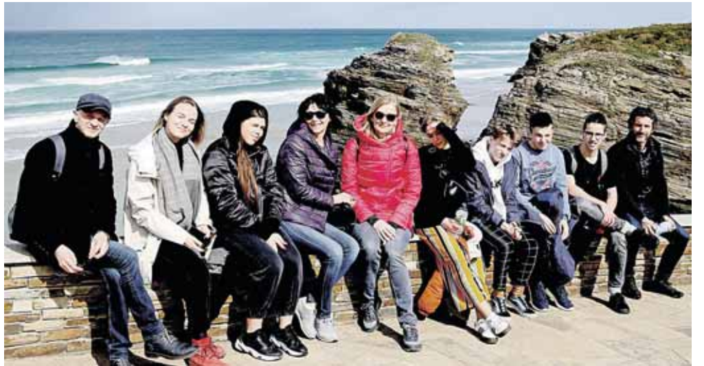
Druskininkiečiai Katedrų paplūdimyje

Po teorinio susipažinimo su Šv. Jokūbo keliu išvykome į praktinę veiklos dalį – trumpam tapome pilgrimais ir, grožėdamiesi Galisijos gamta, nuėjome kelis kilometrus vadinamojo „Camino primitivo“. Kalnuotos apylinkės skendėjo sodrioje žalumoje, žiemą šiame regione iškrenta gausus kritulių kiekis. Vietos gyventojai dėl to tik džiaugiasi, nes daug lietaus žada derlingus metus, begalę jūros gėrybių ir karštą vasarą. Kitas mūsų sustojimas buvo tradiciniame Galisijos kaime O'Cebeiro. Kaimo bažnytelėje saugomi Viduramžiais piligrimų ypač garbinta relikvija – taurė, vadinama „Galijijos šventuoju Graliu“, ir Šventasis Raštas, parašytas keliomis dešimtėmis pasaulio kalbų. Radome ir lietuvišką egzempliorių. Jaukiame kaimelyje