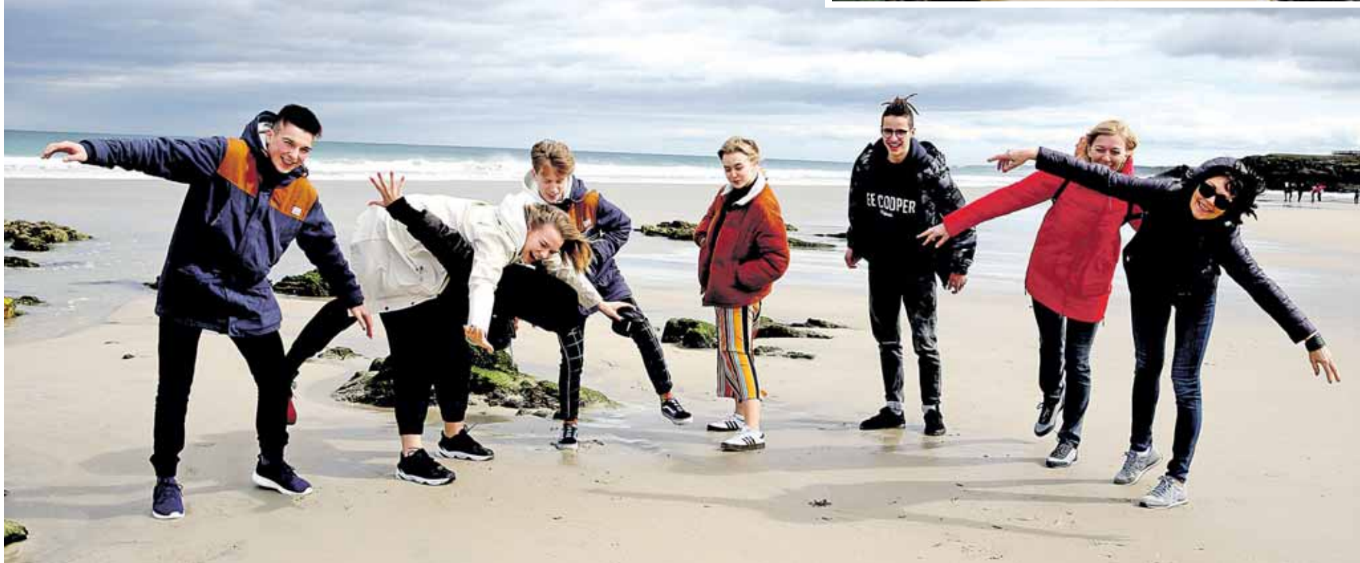
Druskininkų „Ryto“ gimnazijos atstovai Katedrų paplūdimyje Ispanijoje