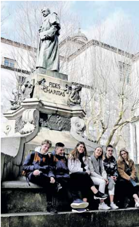
„Ryto“ gimnazistai su ispanų mokiniais Santjago de Kompostela mieste

Dar viena įdomi veikla mūsų laukė mokyklos sporto aikštyne. Gavome prąga parungtyniauti, žaisdam