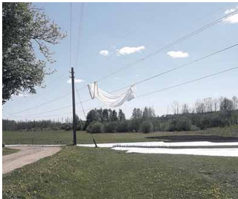
Bet kokia veikla šalia aukštos įtampos elektros tinklų gali būti pavojinga gyvybei – elektros iškrova gali įvykti net nepriartėjus laidų, o tik per arti prie jų priartėjus

„Litgrid“ Pietų regiono vadovas pabrėžia, jog po elektros linijomis draudžiama palikti žemės ūkio techniką, laikyti sukrautas šieno kupetas,