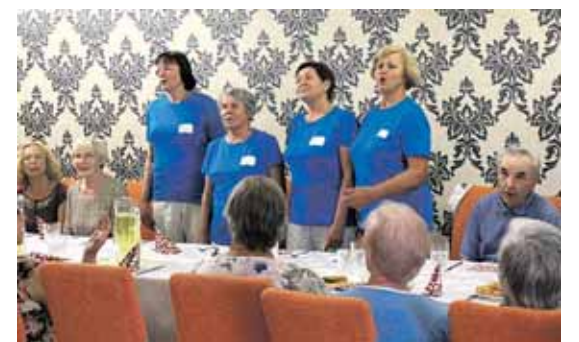
Dainininkės pristato Druskininkų TAU