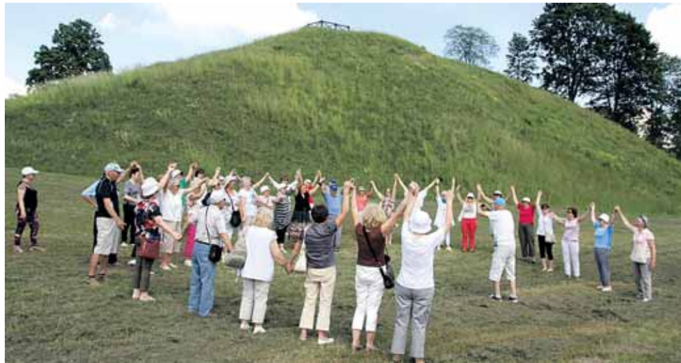
Prie Pagramančio piliakalnio - kelių minučių mankštelė rektoriaus iniciatyva

Kelias iki Varnių neprailgo. Juo labiau, kad autobuse buvo vėsiau – kondicionieriai tinkamai sureguliuoti, todėl visos kelionės metu nepajutome jų neigiamo poveikio. Ačiū vairuotojui, jis apsaugojo nuo susirgimų, susijusių su netinkamu kondicionierių vartojimu. Var-