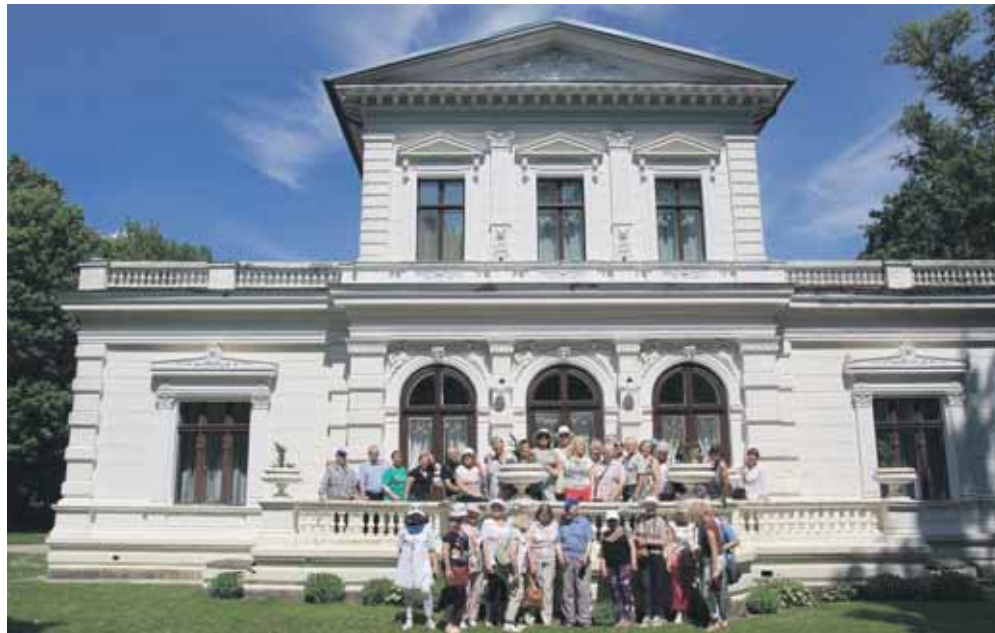
Prie Švėkšnos dvaro rūmų

niuose praleidome vieną valandą. Turėtasi žinias ir prisiminimus lyginome su esamomis.