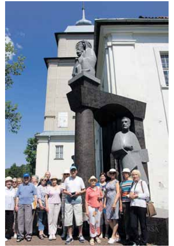
Varniuose, prie seminarijos

Štai ir Tauragė – paskutinis lankymo objektas. Beje, labai keliautojų mėgstamas ir lankomas. Tauragės pilyje – buvusiame kalėjime – įkurtas „Santakos“ muziejus,