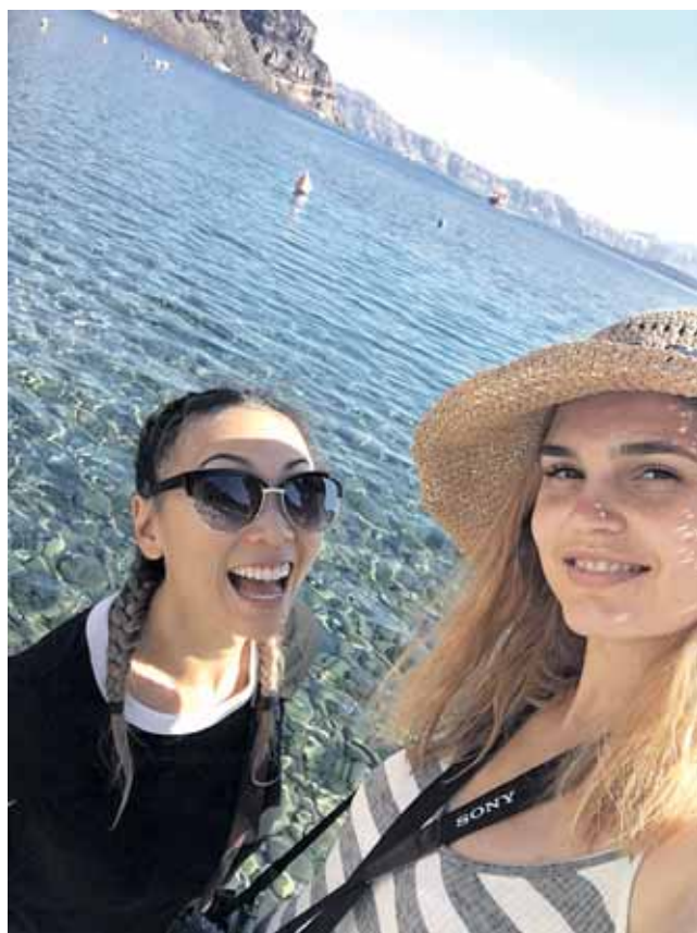
Vienas didžiausių Rūtos pomėgių - kelionės