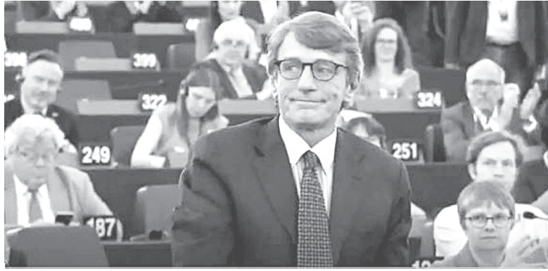
David Maria Sassoli

L iepos 3-ąją Strasbūre į plenarinį posėdį pirmą kartą susirinkęs naujosios sudėties Europos Parlamentas (EP) išsirinko naują vadovą. EP pirmininku dviejų su puse metų kadencijai išrinktas italas David Maria Sassoli. Tuo ypač didžiavosi italai ir stebėti inauguracinės sesijos susirinkę žiniasklaidos atstovai. Mat D.Sassoli yra ilgametis žurnalistas.