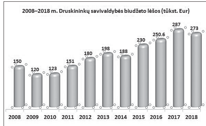
Druskininkų turizmo ir verslo informacijos centrui iš savivaldybės biudžeto skirtos lėšos