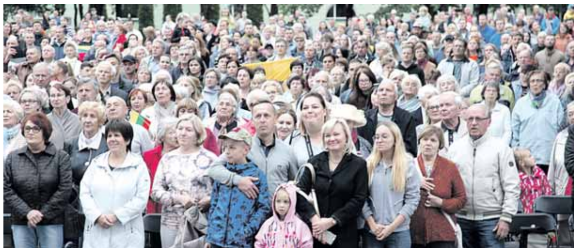
Liepos 6-ąją, Valstybės dieną, giedojome Tautišką giesmę