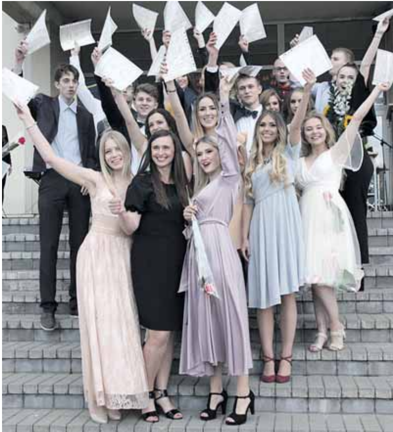
4 d klasė