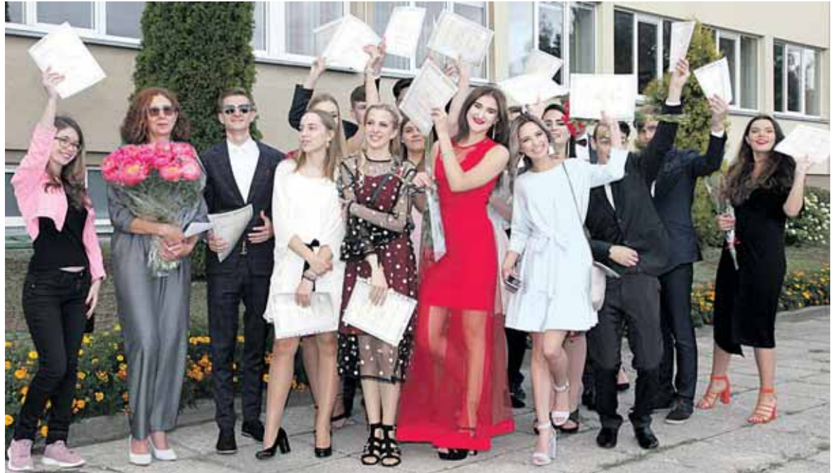
4 b klasė