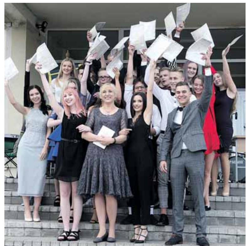
4 e klasė