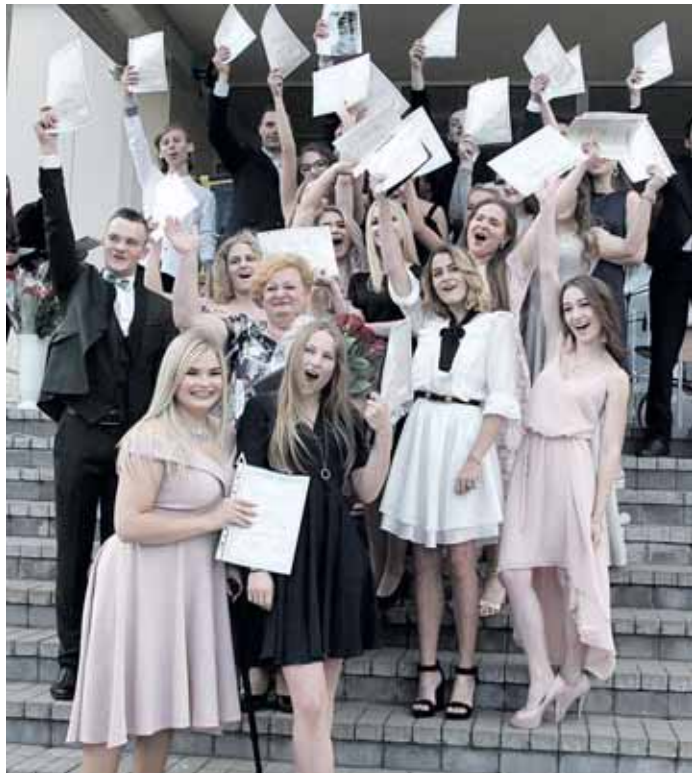
4 a klasė