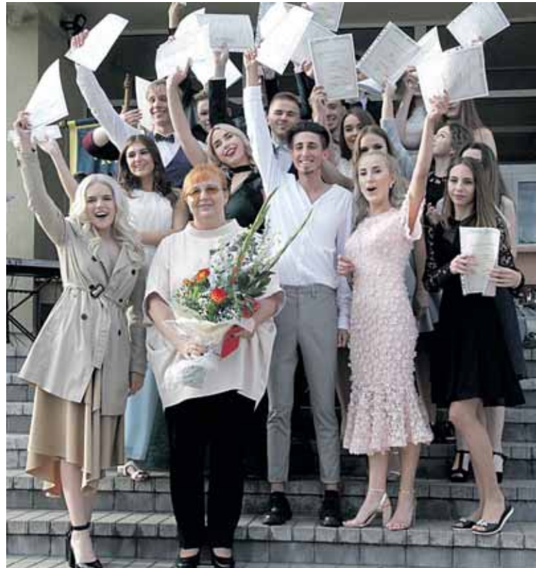
4 f klasė