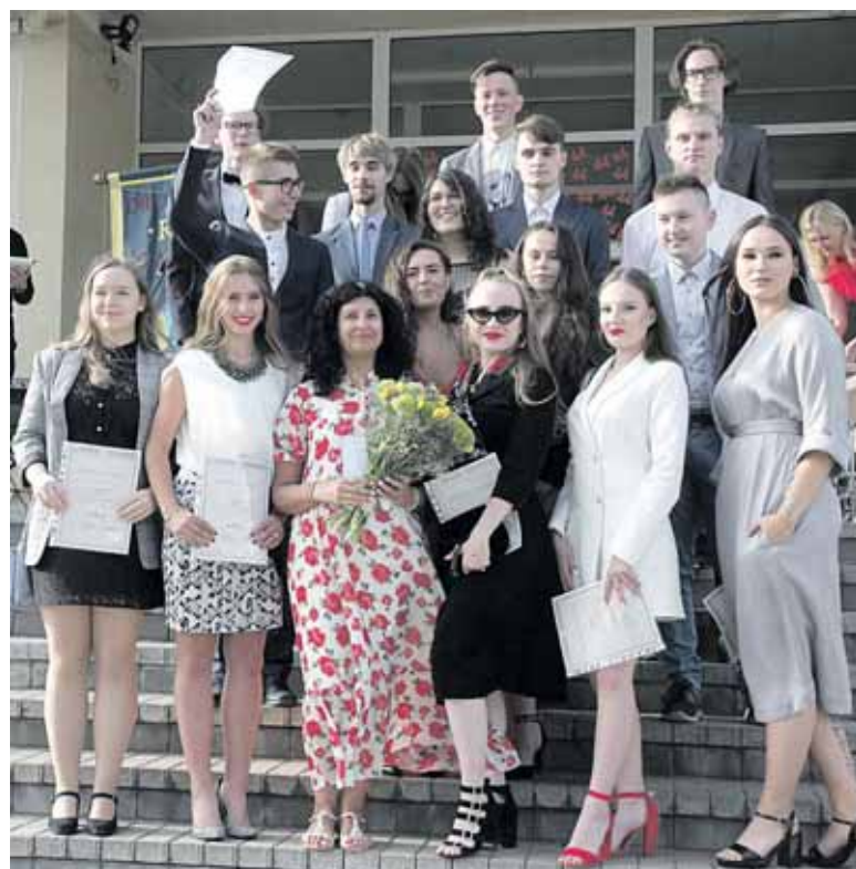
4 c klasė