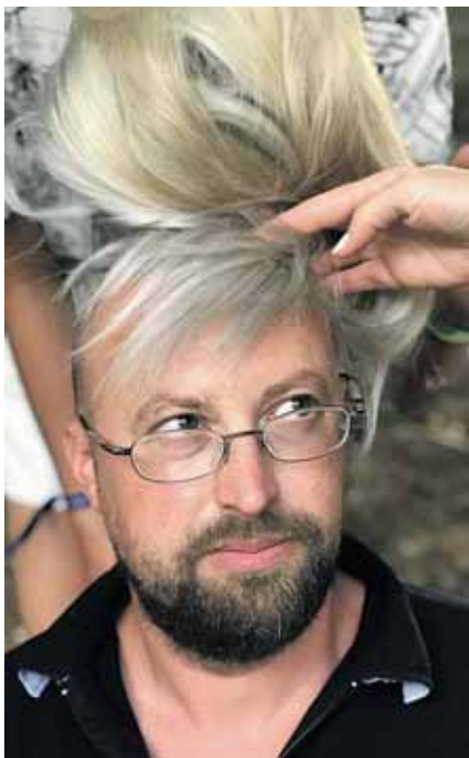
Gediminas Mažintas ir jo kūriniai