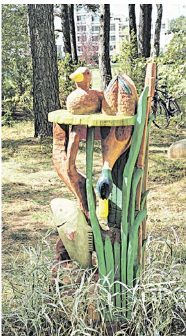
Nauji drožiniai Eglės g. 3 kieme