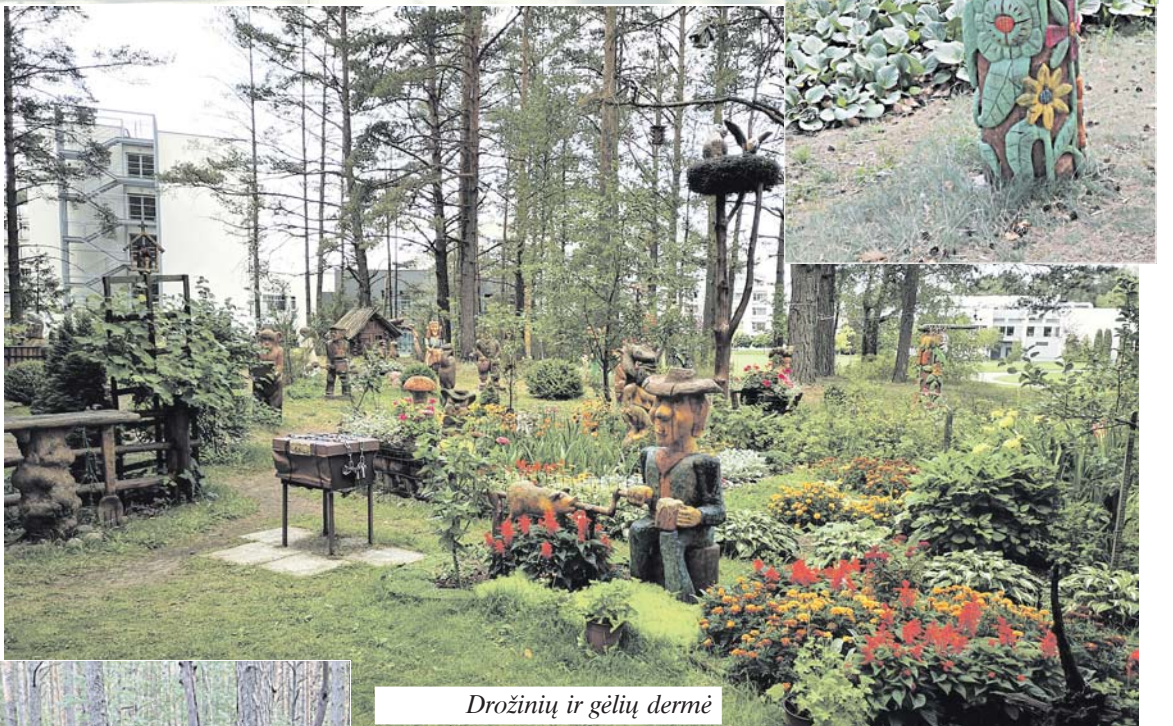
Drožinių ir gėlių dermė