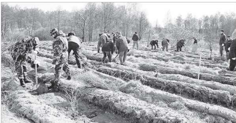
Pareiškėjai į paramą pagal veiklos sritį „Miško veisimas“ gali pretenduoti iki spalio 31 dienos.

Amazonės miškų gaisrai priminė medžių svarbą tvariam klimatui vystytis. Sunku pasakyti, kaip šis įvykis paveiks Lietuvos miškų plotų plėtrą, nes nuoseklūs veiksmai miškų plėtros klausimu vyksta gana seniai. Vienas svarbiausių – KPP priemonės „Investicijos į