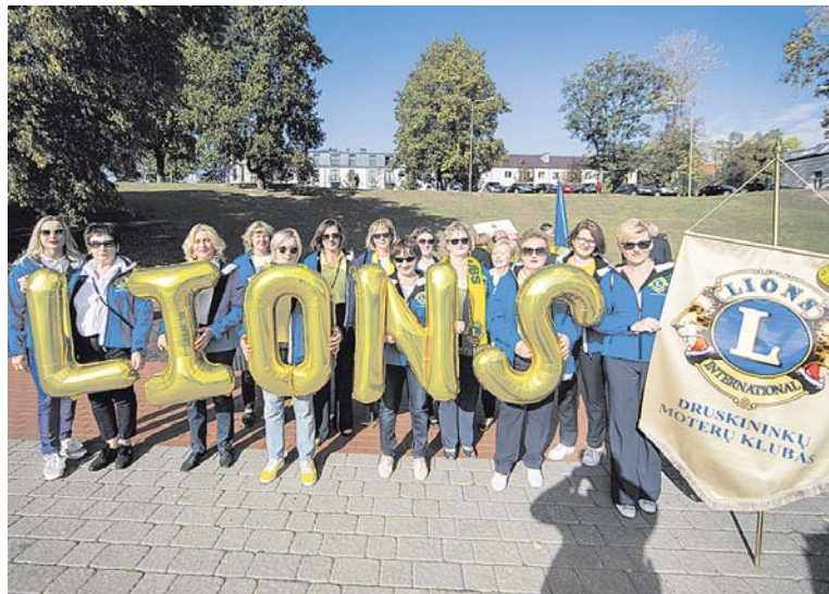
Druskininkų moterų LIONS klubas šventinėje eisenoje rugsėjo 14 d.

Praėjusį savaitgalį Druskininkus užplūdo keletas šimtų „liūtų“ – didžiausios pasaulio klubinės labdaros organizacijos LIONS narių iš daugiau kaip 20-ies Lietuvos miestų. Mūsų šalyje veikia 34 LIONS klubai, vienišantys 670 narių, kurie nori savo laiką skirti visuomeninei veiklai ir padėti kitiems.