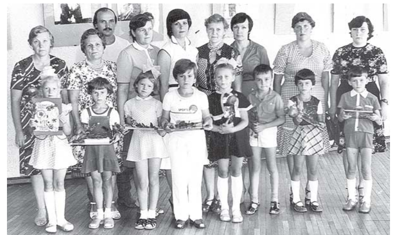
1982 m. „Nemuno“ sanatorijos darbuotojų vaikų palydos į 1-ąją klasę