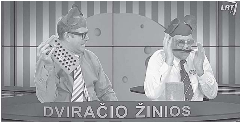
TV laidos stop kadras

Nuo žemės paviršiaus nušluotas Vijūnėlės dvaras – centriniame Druskininkų parke neteisėtai pastatytas privatus namas, dėl kurio viešumoje taip kovėsi R.Malinauskas su savo bendražygiais, nekart skambėjo ir TV satyrinėje humoro laidoje „Dviračio šou“. Praėjusią savaitę „dviračio peliukai“ taip pat aptarė skandalingojo pastato griūtį.