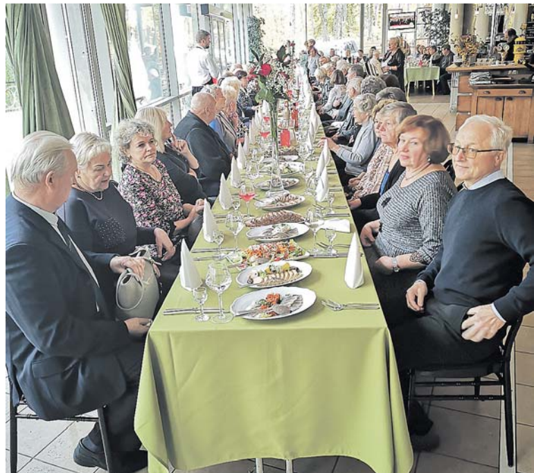
Prie bendro vaišių stalo