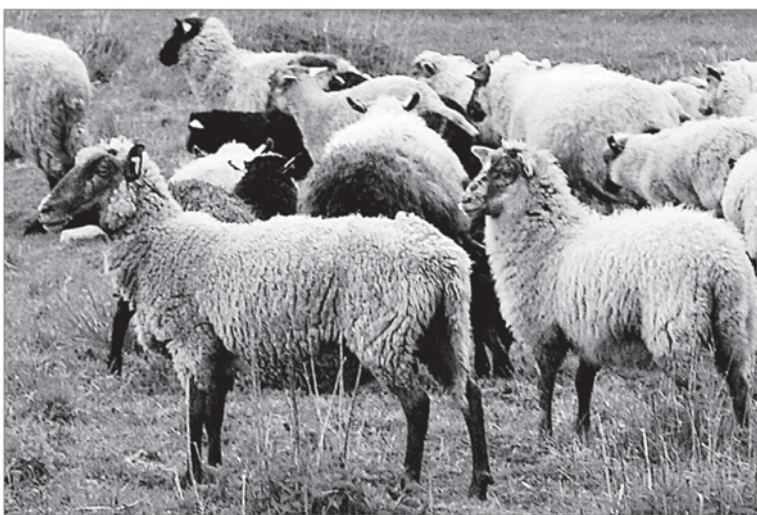
Gyvūnai gali susirgti bet kada. Apdraudus juos nuo ligų, palengvėja ūkininko finansinė našta.

Parama gali būti teikiama ūkininkams, kurie galvijus, arklius, avis, ožkas, kiaules bei naminius paukščius apdraudė nuo ūkinių gyvūnų užkrečiamųjų ligų, dėl kurių privalo būti išnaikinti visi į rizikos grupę susirgti ta liga patenkantys ūkyje esantys ūkiniai gyvūnai. Ligos protrūkio faktą oficialiai turi patvirtinti Valstybinės maisto ir veterinarijos tarnyba. Kritinių ligų sąraše šiuo metu yra apie 30 pavojingų ligų, tarp jų – galvijų maras, avių ir ožkų maras, kiaulių vezikulinė liga, mėlynosjo liežuvio liga, Tešeno liga, avių (ožkų) raupai, Rifo slėnio karštinė, gumbelinė, afrikinė arklių liga, vezikulinis stomatitas, Venesuelos arklių virusinis encefalomielitas, klasikinis kiaulių maras, afrikinis