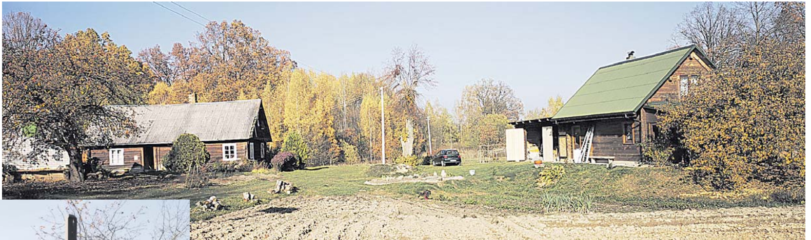
Iš buvusių 8-ių sodybų Janave beliko tik viena su dviem gyventojais