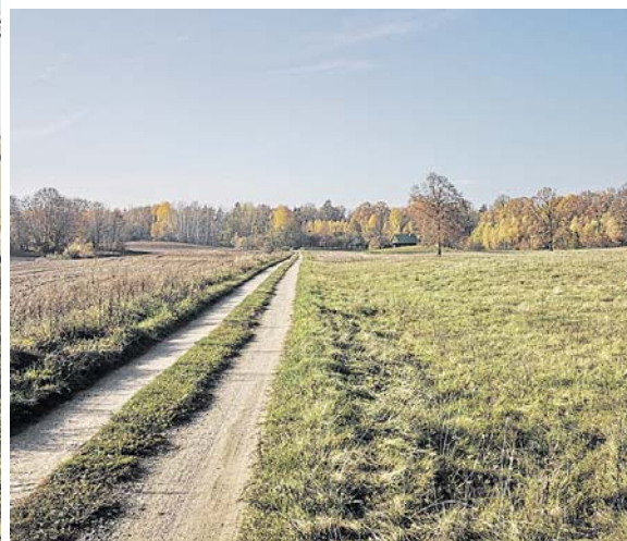
Kelias link Janavo