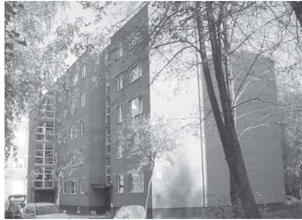
Daugiabutis Liškiavos g.31, kur gyveno garsūs poetai Nijolė Miliauskaitė-Bložienė ir Vytautas Petras Bložė