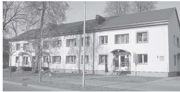
Šiame name pačiame miesto centre, M. K. Čiurlionio g. 44, gyveno žymus rašytojas Ričardas Gavelis