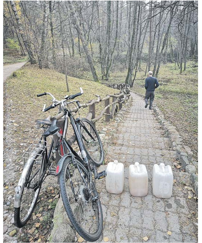
Prie Jaskonių arba Ratnyčios šaltinio, esančio prie pat kelio į Naujasodę