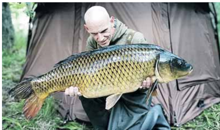
Nuotraukos iš asmeninio archyvo