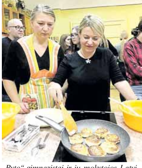
„Ryto“ gimnazistai ir jų mokytojos Latvijoje