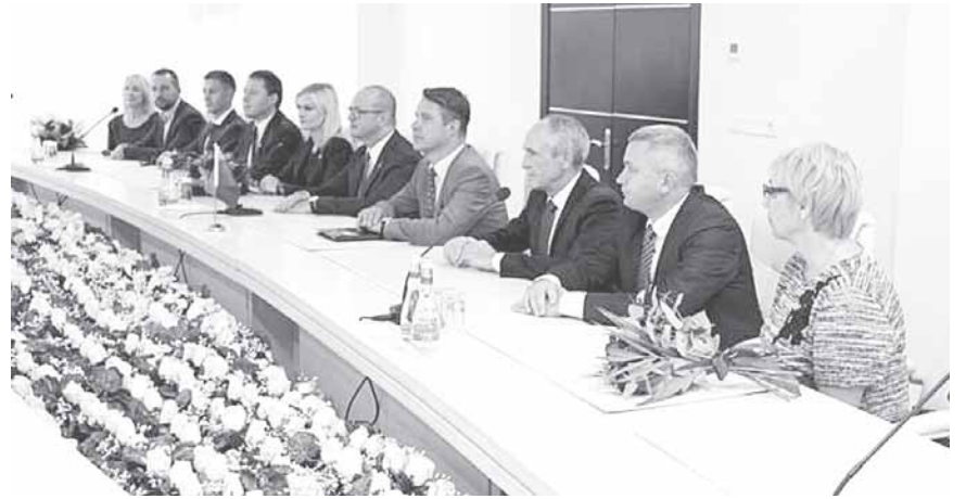
Neapsirikite, Druskininkų delegacija sėdi ne šermenyse, bet priėmime pas Azerbaidžano kolegas. Ten turbūt tokia mada rožių „kilimais“ puošti valdžios posėdžių sales