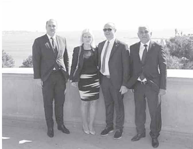
„Ryšių stiprinimo“ fotoakimirkos Azerbaidžane