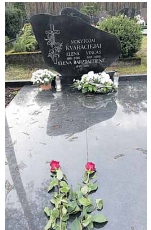
Gėlės ant amžinybės išėjusių mokytojų kapų

gos sudarytojai ir rėmėjai, kitą dieną padalinta ant amžinybės išėjusių mokytojų senjorų kapų. Lapkričio 15-ąją „Atgimimo“ mokykloje vėl susitiko buvusieji bei dabartiniai mokytojai ir mokiniai. Drauge atidengė atminimo lentą pirmajai lietuviškai mokyklai priminti pirmojo mokyklos direktoriaus Domininko Viščinio vardu pavadintame mokyklos vidiniame kiemelyje. Sekmadienį, lapkričio 17-ąją, jie kartu meldėsi Druskininkų bažnyčioje, kur aukotos šv. Mišios už mirusius mokyklos mokytojus ir mokinius.