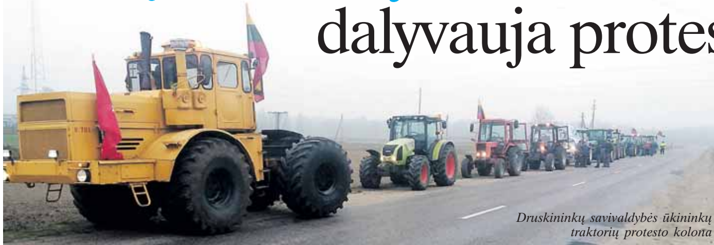
Druskininkų savivaldybės ūkininkų traktorių protesto kolona

Lapkričio mėnesį visos šalies dirbamos žemės plotuose šalia kelių ūkininkai pristatė žalios spalvos kryžius, kurie simbolizuoja žemės ūkio žlugdymą ir kaimo mirtį. Miškingoje mūsų savivaldybėje, kur dirbamų laukų yra mažiau nei kitur Lietuvoje, protesto kryžių galbūt irgi mažiau bestovi, tačiau vietiniai ūkininkai aktyviai palaiko visos šalies žemdirbių reikalavimus ir dalyvauja protesto akcijose. Kaip teigia Lietuvos ūkininkų sąjungos plakatas, žaliasis kryžius statomas už: derlingą dirvožemį ir sveiką aplinką; sveikus augalus ir gyvulius; sveiką ir skanų lietuvišką maistą. Žaliasis kryžius statomas prieš: visuomenės ir žemdirbių supriešinimą; nepakeliamą biurokratinę našta; kainas, žemesnes už savikainą; nuolat didėjančius ir nebepakeliamus mokesčius; ūkių nuvaramą nuo žemės; Lietuvos žemdirbių diskriminaciją ES.