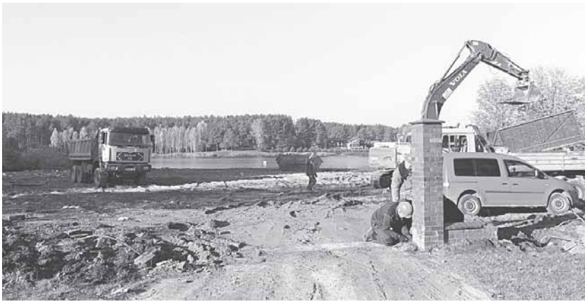
Žemės darbai buvusio Vijūnelės dvaro teritorijoje

„Visi prisimenam, kai pradėjo statyti, buvo daromi tokie žemės sutvirtinimai, jog atrodė, kad statoma kažkokia slapta karinė ba-