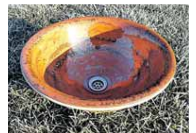
Algimanto Kazlauskio keramika