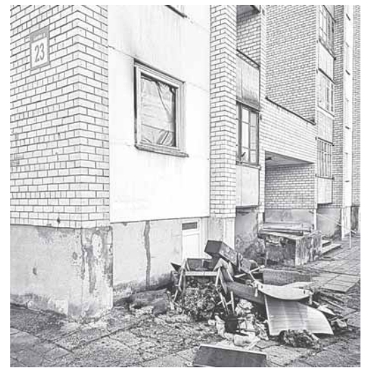
Gaisro daugiabutyje gyv. name Gardino g. 23 padariniai

Gruodžio 13 d., penktadienį, apie 22.40 val., Druskininkų ugniagesiams gelbėtojams pranešta apie gaisrą daugiabutyje gyv. name Gardino g. 23. Apie 1-ajame aukšte degantį butą informuota ir greitoji medicinos pagalba. Iš daugiabučio buvo evakuota apie 70 žmonių.