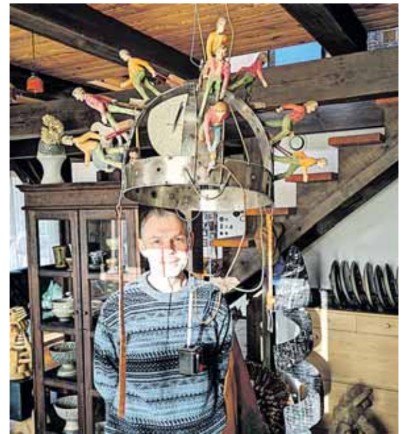
Šalia kūrinio „Emigracija“