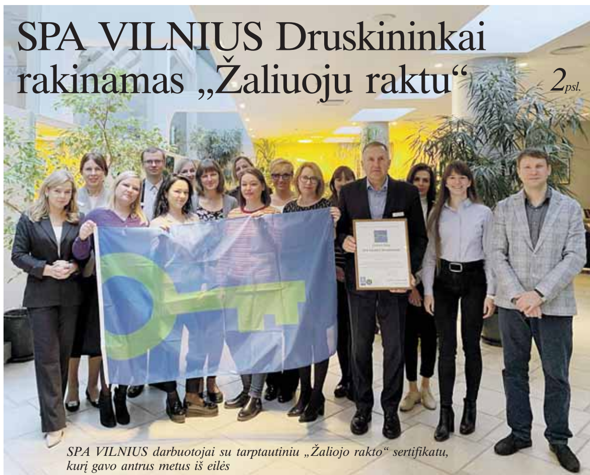
SPA VILNIUS darbuotojai su tarptautiniu „Žaliojo rakto“ sertifikatu, kurį gavo antrus metus iš eilės