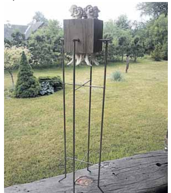
„MATRICA - priklausomybė“