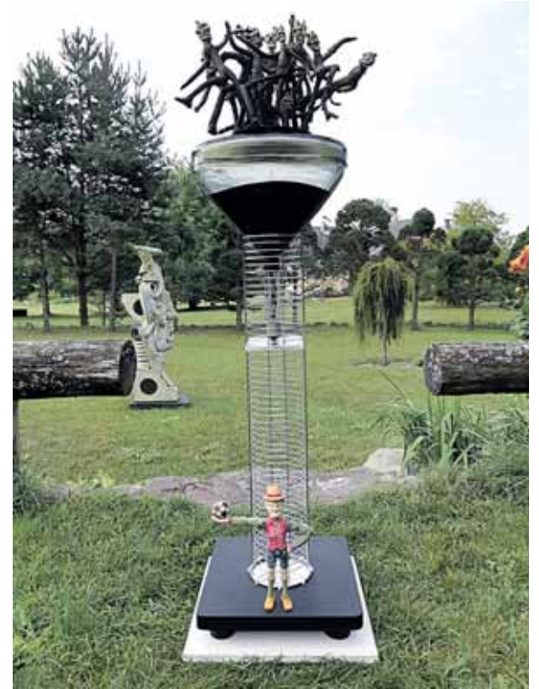
„Pristatymas į namus“