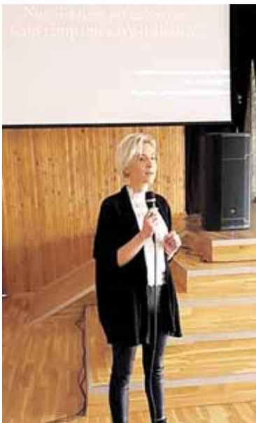
Narkotinių medžiagų vartojimo prevencijos renginyje „Ryto“ gimnazijoje

Šių renginių ciklas skirtas ne tik suteikti daugiau žinių paaugliams apie psichoaktyviųjų medžiagų var-