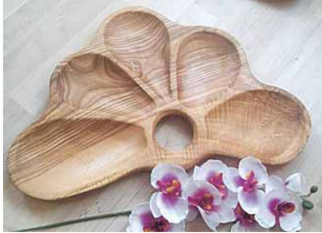
Dailūs Algirdo medienos dirbiniai