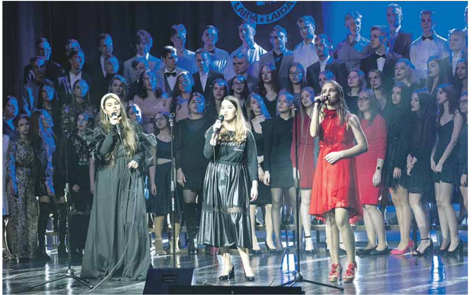
Fotoreportažas iš Druskininkų “Ryto” gimnazijos abiturientų šimtadienio šventės