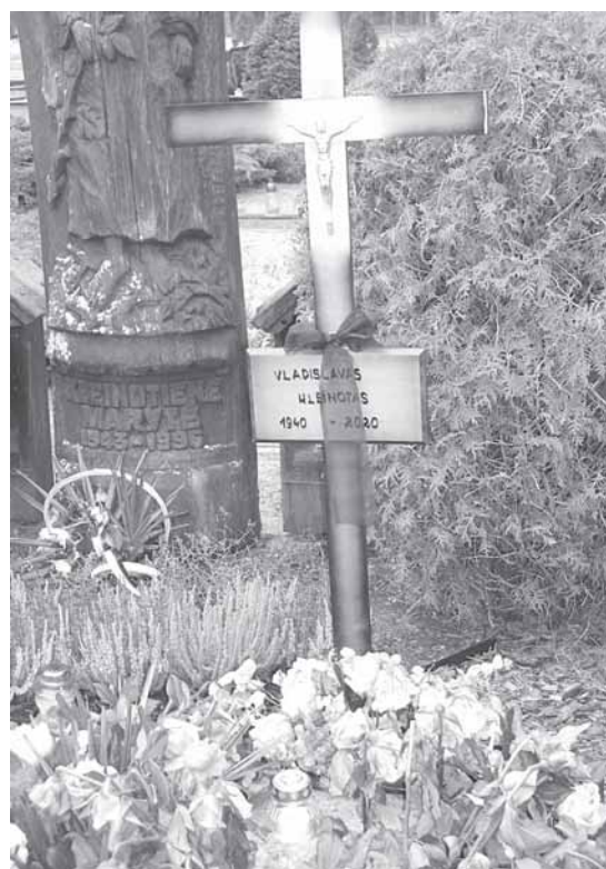
V.Kleinotas amžinybės poilsio atgulė šalia žmonos kapinėse Ratnyčioje