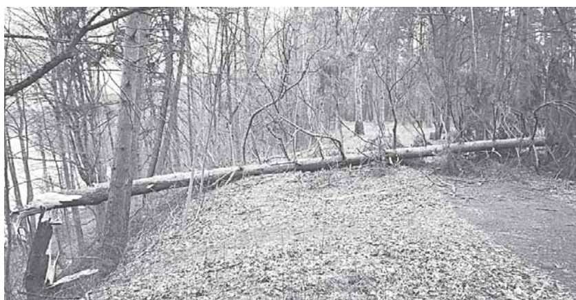
Vėjo nulaužta eglė prie Nemuno, Kurorto gatvėje