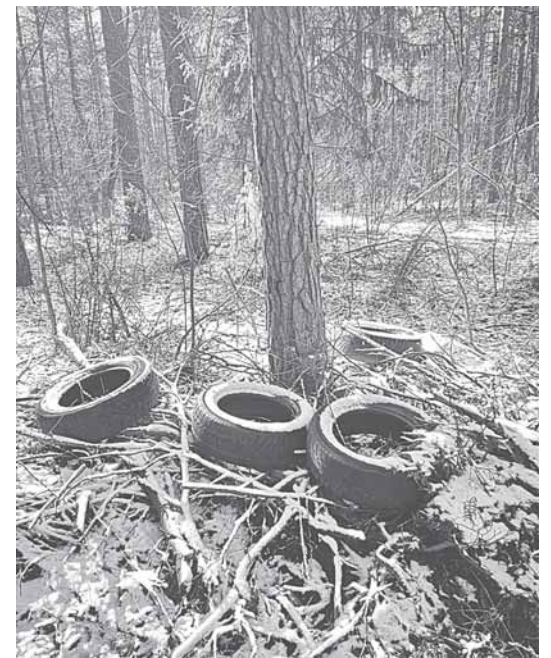
Išmestos padangos prie miško kelio tarp Druskininkų ligoninės ir Ratnyčios