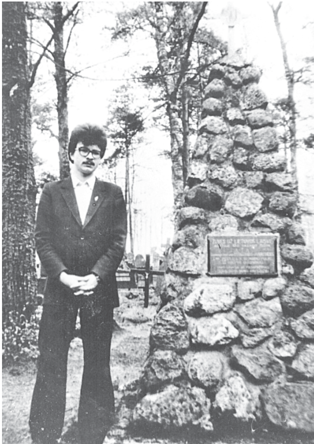
1982 m. Išleistuvių į sovietų armijos rekrūtus dieną Leipalingyje

Svarsčiau, ar man derėtų dalyvauti 1987 m. rugpjūčio 23 d. patriotų rengtoje demonstracijoje prie Adomo Mickevičiaus paminklo Vilniuje, kuria ketinta pasmerkti tądien pasirašytą Molotovo-Ribentropo paktą, sąlygojusį sovietinę Baltijos šalių okupaciją. Represijų atveju studijų Pogrindžio seminarijoje nebūčiau galėjęs tęsti. Nuvažiauvau į Valkininkus, atlikau išpažintį