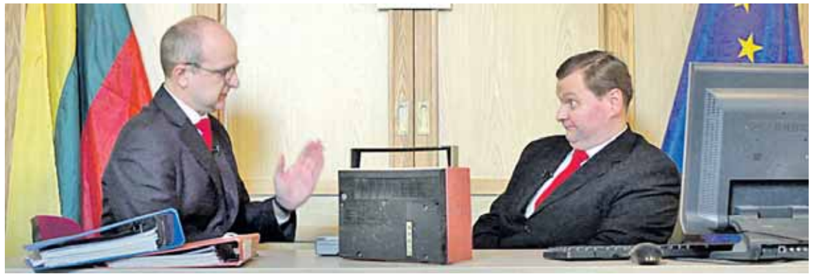
„Dviračio žinių“ stop kadras: „Ričardas Malinauskas ir Skvernelis“

„Haha ha, – nusikvatoja premjeras. – Bet Skirmantas Malinauskas kovojo su virusu“. „Aš Druskininkuose kovojau su visokiom zara-