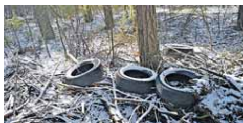
Išmestos padangos prie miško kelio tarp Druskininkų ligoninės ir Ratnyčios

Pritaria konfiskuoti šiukšlintojų transporto priemones