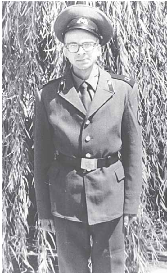
1982 m. Rekrūtas sovietų armijoje – jau po viešo priesaikos atsisakymo Kazachstane