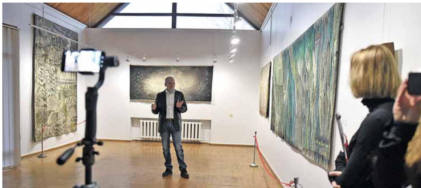
Parodos atidaryme apie savo mamą ir jos gobelenus papasakojo žinomas žurnalistas Romas Sadauskas-Kvietkevičius