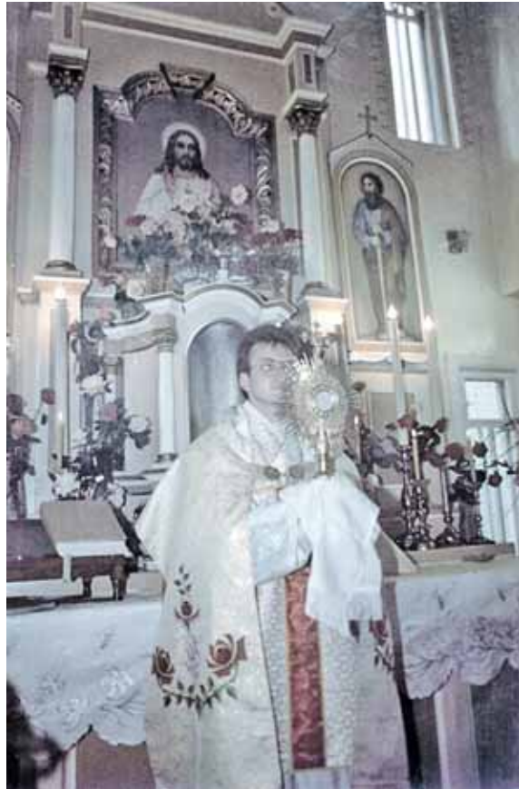
1988 09 04. Primicijos - pirmosios iškilmingos šv. Mišios – Kiauklių bažnyčioje

Mane slėgė ne tiek pati mintis, kad reikės paklusti kazarmų tvarkai, kiek tai, jog tarnybos pradžioje reikės prisiekti ištikimybę okupacinei armijai, kuri niokojo mano Tėvynę. Net svarsčiau – galbūt pasitraukti į Dzūkijos miškus ir taip išvengti tarnybos armijoje (tų svarsčių pėdsakai anuomet parašyta me eilėraštyje: „Žvelgiu į tankmes