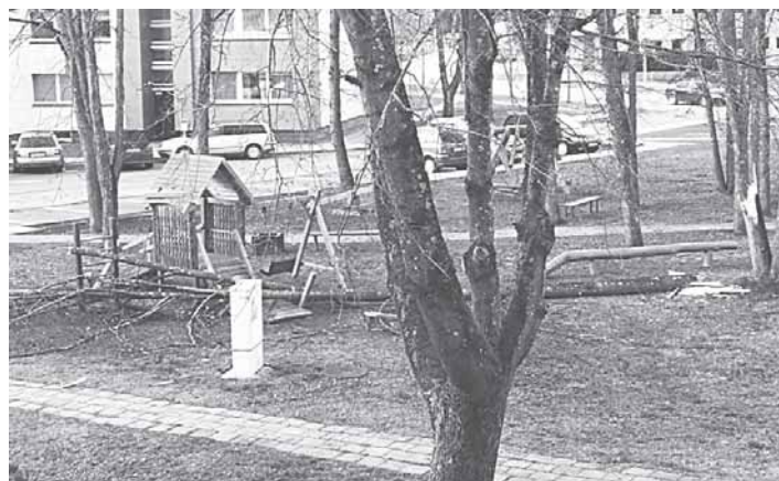
Po stiprios liūtės kovo 14 d. nukritęs medis vaikų žaidimų aikštelėje Vytauto gatvėje