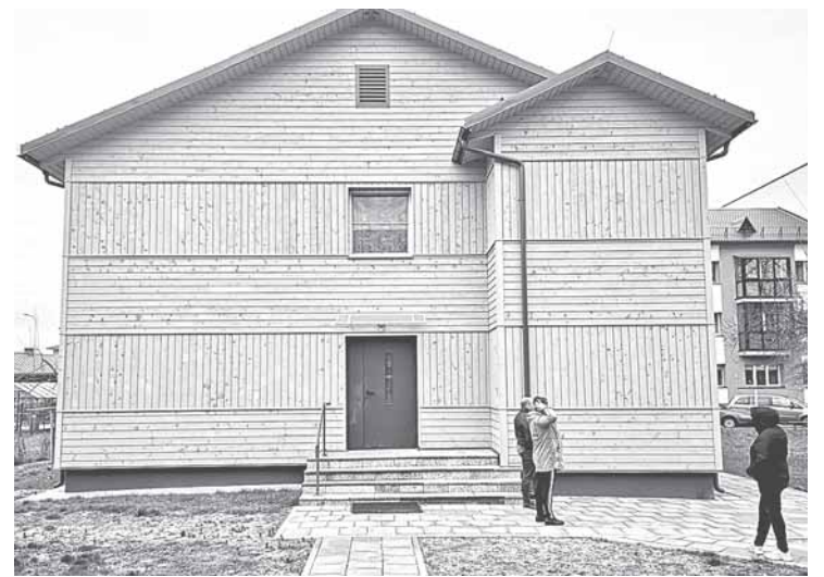
Į ginčo koridorių iš kiemo patenkama pro šias pastato M.K.Čiurlionio g. 6 duris