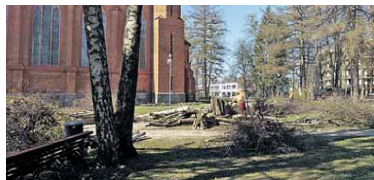
Praėjusią savaitę skaitytojai „Druskoniui“ atsiuntė nuotraukų