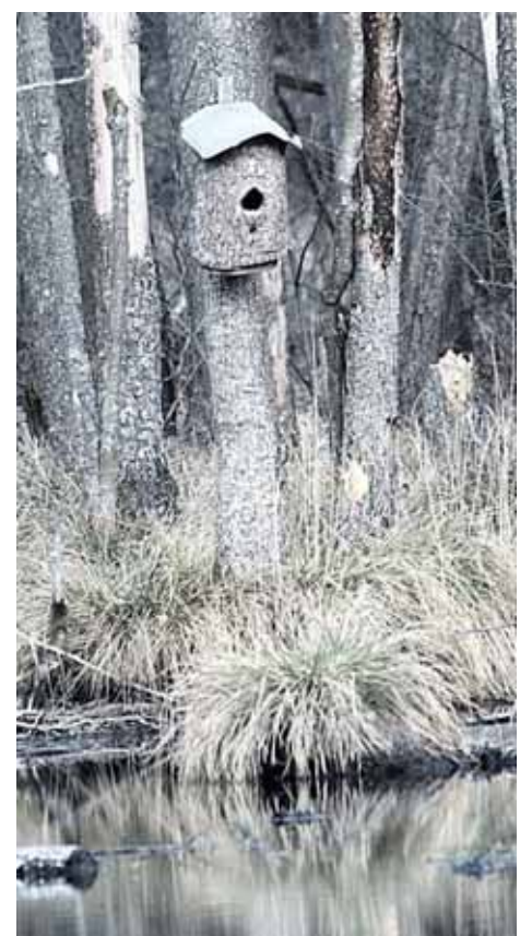
Inkilas antims klykuolėms

šešioliktąją paskambino draugas miškininkas, sako, girininkas miške matė jaunos kurtinukas, pasakė kvartalą, sklypą. Nuvažiavau patikrint, bet kur ten rasi, prasidėjo lietus, o jaunikliams, be plėšrūnų, yra pavojingi lietingi pavasariai, nes jie, ne taip kaip ančiukai, bijosi lietaus, peršlampa ir sušąla. Tad per lietų gal kur po eglaitę kurtinukai pasislėpė. Normalų pavasarį kurtinių jaunikliai pasirodo gegužės pabaigoje - birželio pradžioje, o šiomet viskas susimaišė.