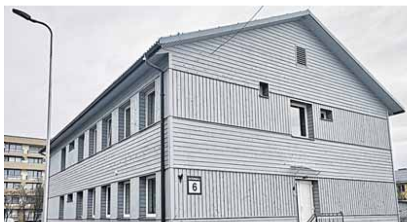
Gyvenamasis pastatas M.K.Čiurlionio g. 6