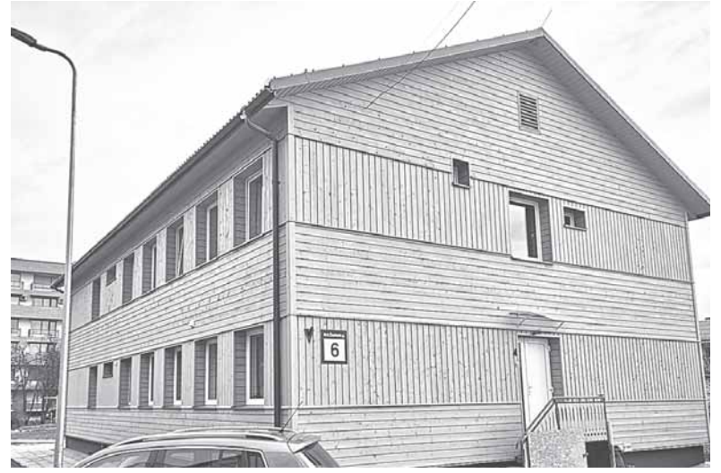
Gyvenamasis pastatas M.K.Čiurlionio g. 6