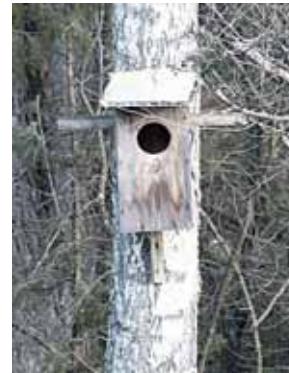
Inkilas naminei pelėdai