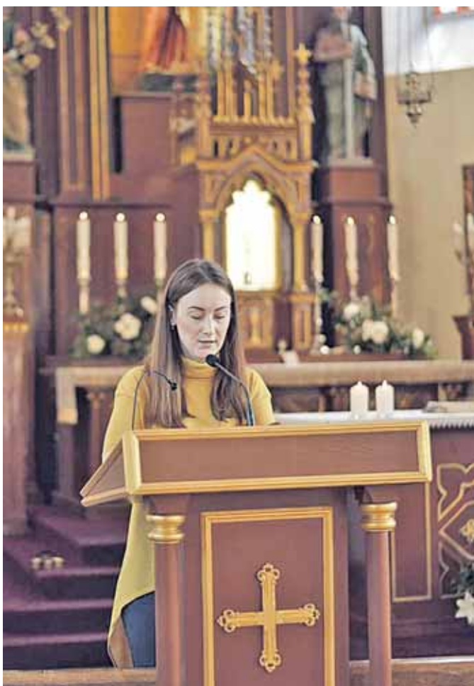
Ratnyčios Šv. apaštalo Baltramiejaus bažnyčioje šv. Mišių metu