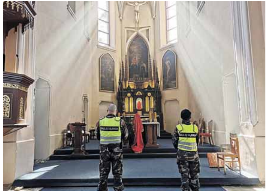
Prašant pagalbos ir Dievo užtarimų Druskininkų bažnyčioje balandžio 5-ąją