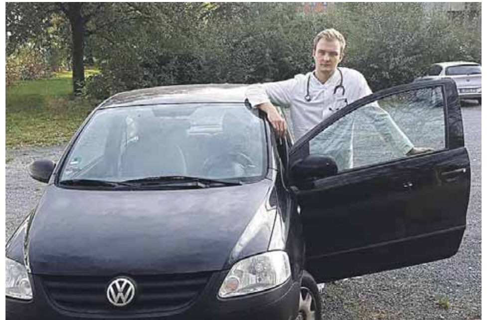
Tarnybinis transportas medicinos studentams Vokietijoje

Pašnekovas neneigia, jog aparatas turi trūkumų ir jį dar bandys tobulinti. Skeptikai, anot jo, galbūt