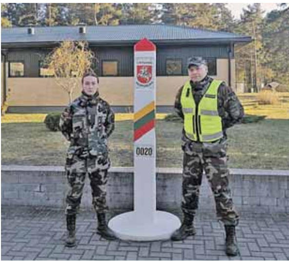
Vaida užtikrinant viešąją tvarką mieste karantino metu