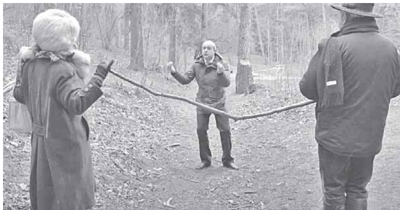
TV laidos „Dviračio šou“ stop kadrai

„Tai mums tiesiog išvažiuoti?“ – savo ausimis niekaip negali pati-kėti poilsiautojas. „Išvažiuokit, iš-eikit, dinkit! Išgaruokit kaip dū-mas!“ - išrėkia jiems „Malinaus-kas“.