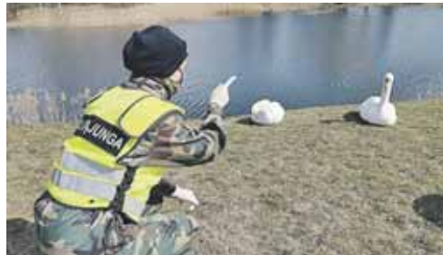
Užtikrinant viešąją tvarką prie Druskonio ežero