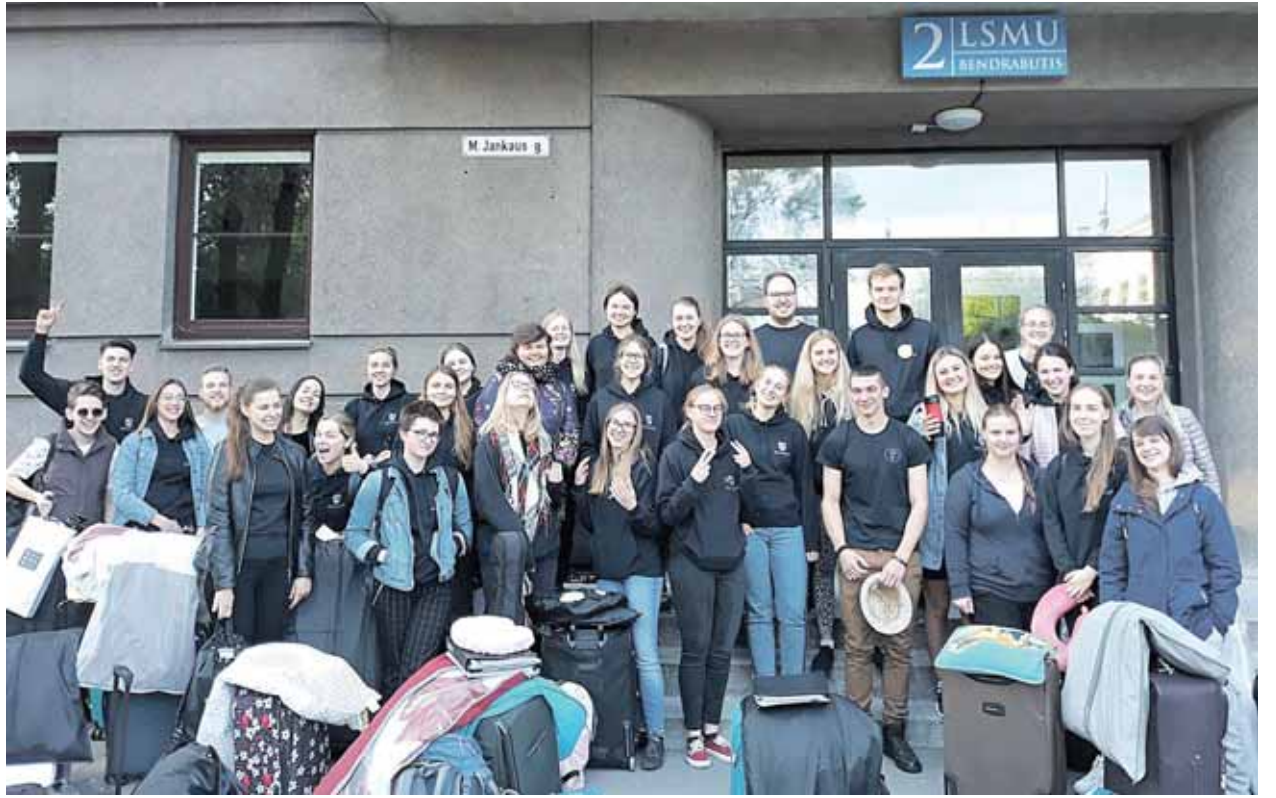
Su akademinio choru „Neris“ prieš kelionę į Šiaurės Makedoniją