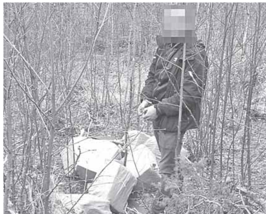
Su įkalčiais įkliuvęs įtariamasis

Į Druskininkų pasieniečių pasalą pateko jau žinomas vietinis kontrabandininkas. Balandžio 9 d. Varenos rinktinės Druskininkų pasienio užkardos pareigūnai ties Druskininkų savivaldybės Latežerio kaimu pastebėjo įtartinus pėdsakus, vedusius link valstybės sienos. Įtarta, kad šioje vietoje į Lietuvą iš Baltarusijos galėjo būti gabenamas neteisėtas kroviny, apylinkės ėmėsi tikrinti pasieniečių patruliai bei kinologas su tarnybi-