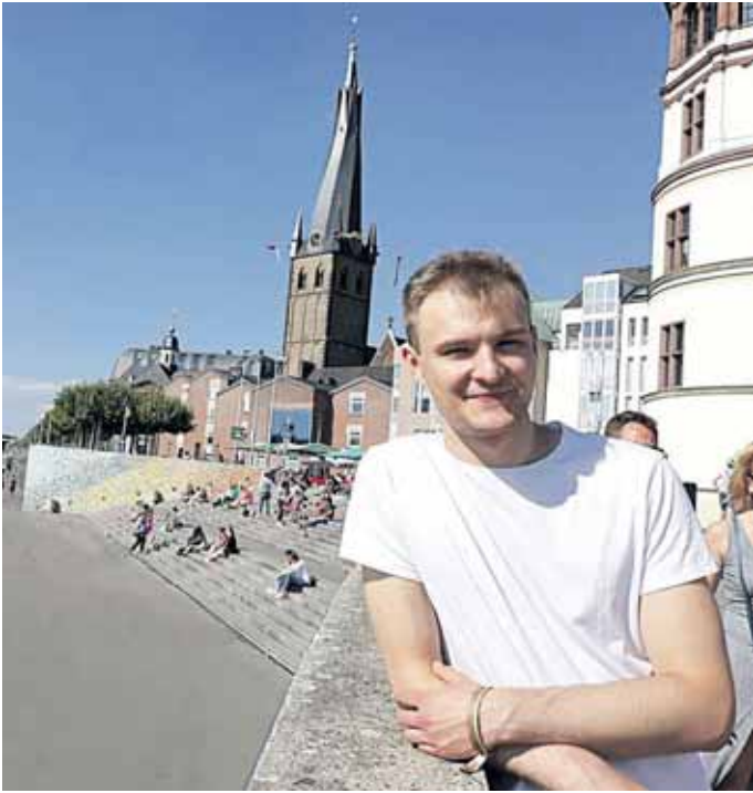
G. Sokolovas Diuseldorfe Vokietijoje