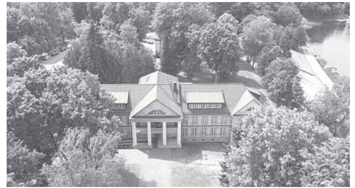
„Draugystės sanatorijos“ korpusas

Tarpukario Druskininkų klestėjimui ir atgimimui buvo