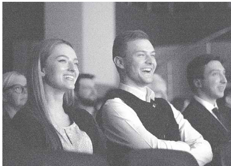
Iš „Laikykites ten“ filmavimo Druskininkuose