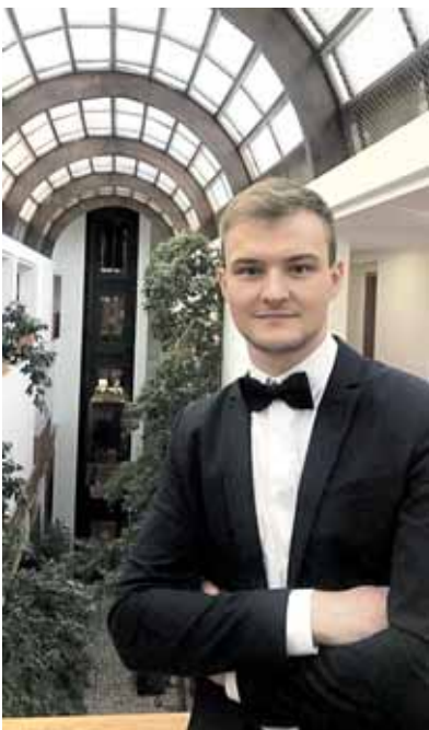
Prieš koncertą „Vilono“ viešbutyje