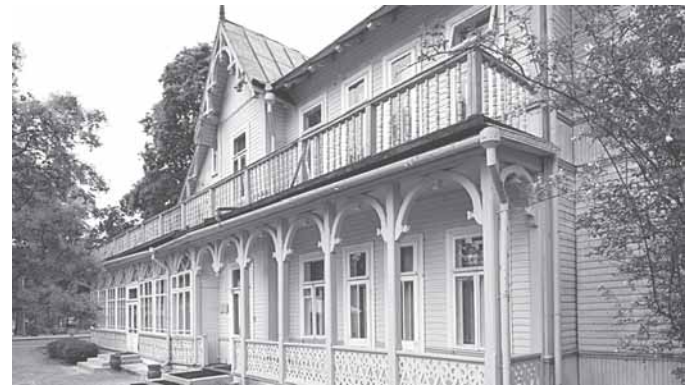
Vila Maironio gatvėje