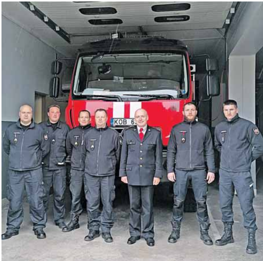
Druskininkų ugniagesiai gelbėtojai

- Ko gero, jūsų pasitikėjimas gyventojais yra gerokai mažesnis nei pastarųjų jumis, nes gaisrų suvestinėse dega patalpos, ku-