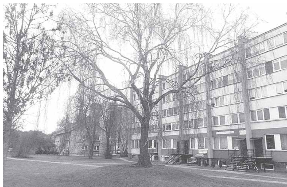
Jaunimo bendrabutis Gardino g. 36, kur 1968 m. įvyko atmintinas susitikimas su meni- ninkais

mane jaunųjų lite- ratų būrelio na- riu“. E.Mieželaitis papasakojo apie savo nedrąsą pa- žinti su poetu Ka- ziu Binkiu, kuris su 17-mečiu poe- tu bendravo kaip su profesionalu, išsitaręs, jog kriti- kai jam leidžia būti ilgalaikėse atos- togose. „Kulto metais mums buvo padaryta didelė skriauda ir to nesu- gražinsi, - tęsė E.Mieželaitis. - Su- dėtingų ginčų sukuryje teko ir man dalyvauti. Parašiau knygą „Žmo- gas“, kuri turi programinį deklara-