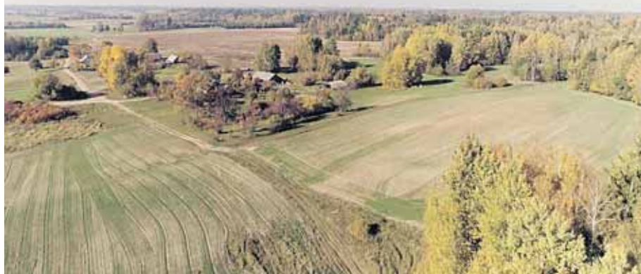
Filmuko „Po baltų Lietuvą (padavimų žemėlapis)“ kadras