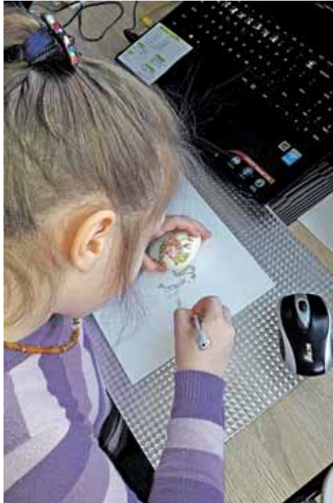
Ievos mokinė Tėja, kurios tėveliai visada atsiunčia nuotraukų, kaip jai sekasi dalyvauti tikybės pamokoje per nuotolį