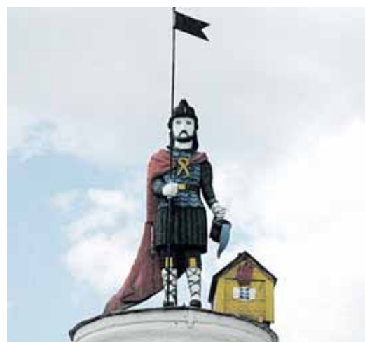
Šv. Florijono skulptūra Rumšiškėse

„Šv. Florijono dieną šiomet švęsime kiek kitaip nei kasmet“