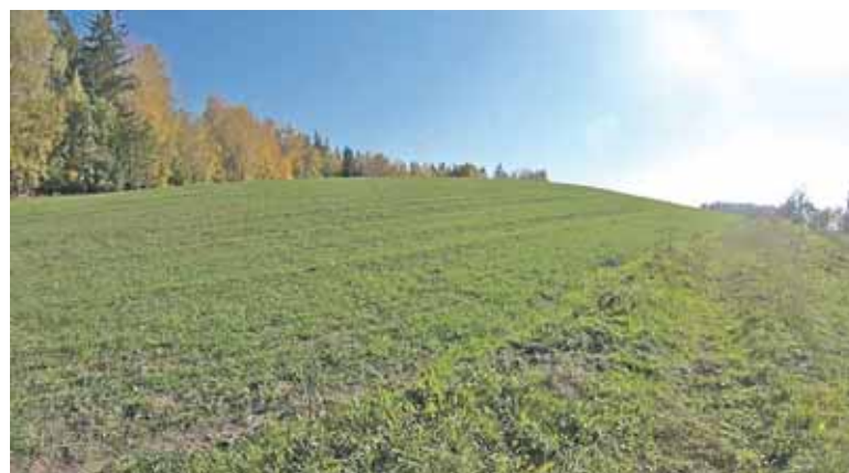
Filmuko „Po baltų Lietuvą (padavimų žemėlapis)“ kadrai