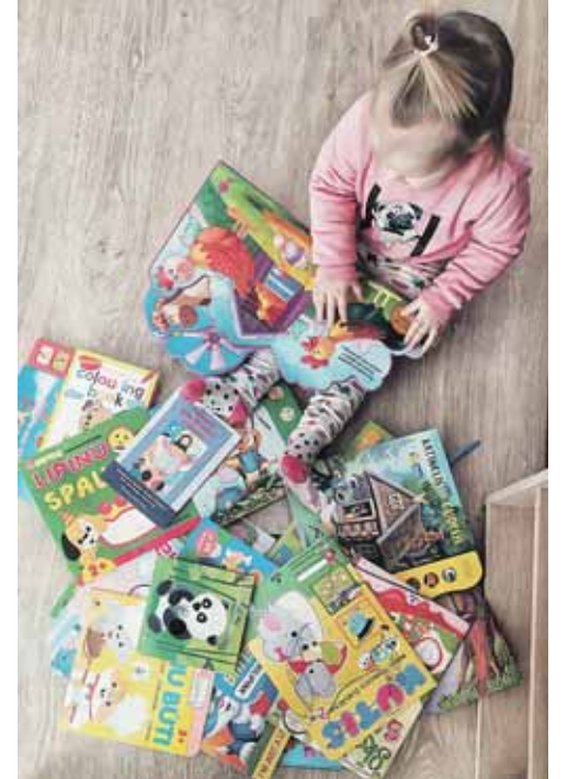
Agotos nuotolinis mokymasis su knygų gausa