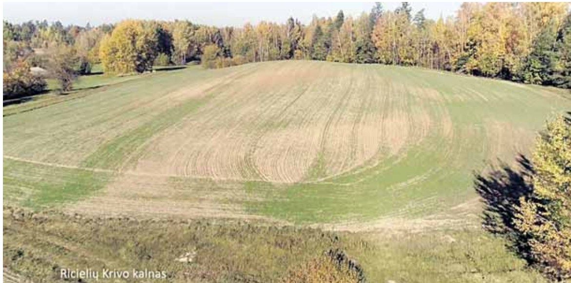
Ricielių Krivo kalnas