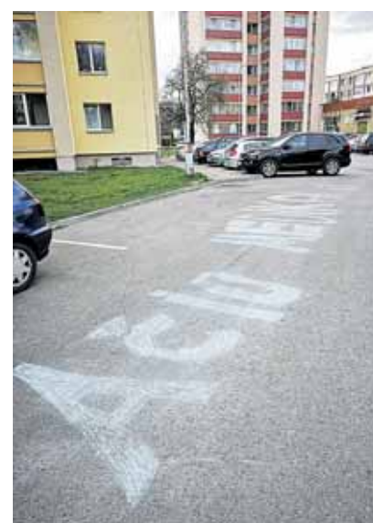
Šitai originaliai savo kaimynus medicinos darbuotojus jų profesinės dienos proga balandžio 27-ąją pasveikino savo kieme Druskininkų gatvės gyventojai