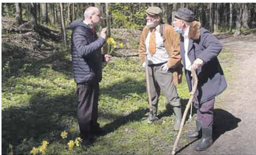
Humoro laidos „Dviračio žinios“ kadrai

buvo, kad tiek daug milijonų gavot, a?“.