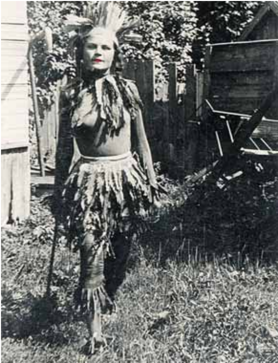
1935 m. Onutė su maskradine indėnės papuasės apranga