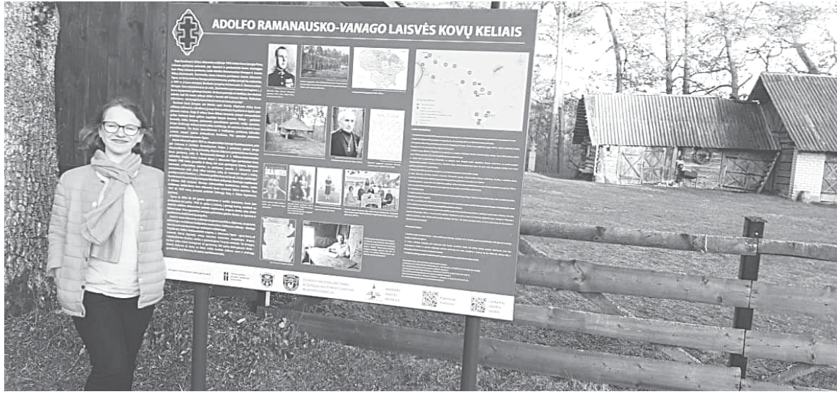
Straipsnio autorė Kasčiūnuose, prie buvusios A. Ramanausko-Vanago vadovietės

Nedidelis Kasčiūnų kaimas pamiškeje, ant aukšto Merkio kranto, tolokai nuo pagrindinių kelių, visą tą neramų laikotarpį buvo partizanų atspara ir prieglobstis, patikimai saugojęs ir globojęs laisvės šauklius. Nepavykus pagerinti radijo ryšio, partizanų vadas Juozas Vitkus-Kazimieraitis ir dalis štabo narių paliko žieminę vadovietę. Persikėlė į Adolfo Ramanausko-Vanago vadovietę Kasčiūnų kaime, Juozo