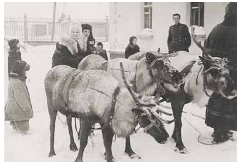
1956 m. Intoje, Komijoje