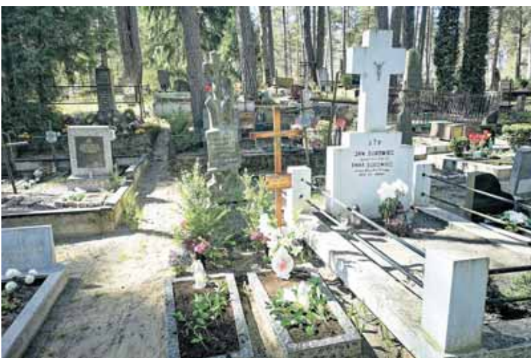
Suraučių giminės amžinojo poilsio plotas Druskininkų senosiose kapinėse