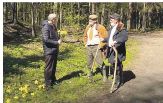
Humoro laidos „Dviračio žinios“ kadrai

Suvalkiečių ūkininkai Druskininkuose: čia ne kurortas, o paprasčiausias miškas!