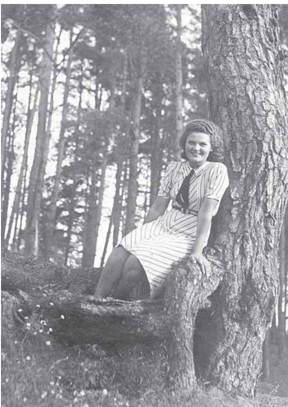
1940 m. Druskininkuose