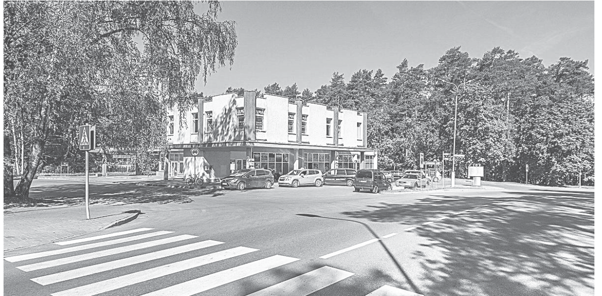
Druskininkų autobusų stotis iš šono ir viršaus

- Nuo šio pirmadienio, gegužės 18 d., jau pradėjom veiklą, atidarom populiariausius maršrutų reišius. Per dieną vienas reišis važiuoja į Kauną ir vienas iš Kauno, du reišiai į Vilnių ir du reišiai iš Vilniaus. Pradėjo dirbti stotis, siuntę terminalas.