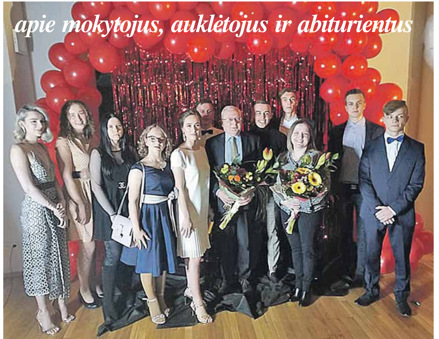
apie mokytojus, auklėtojus ir abiturientus