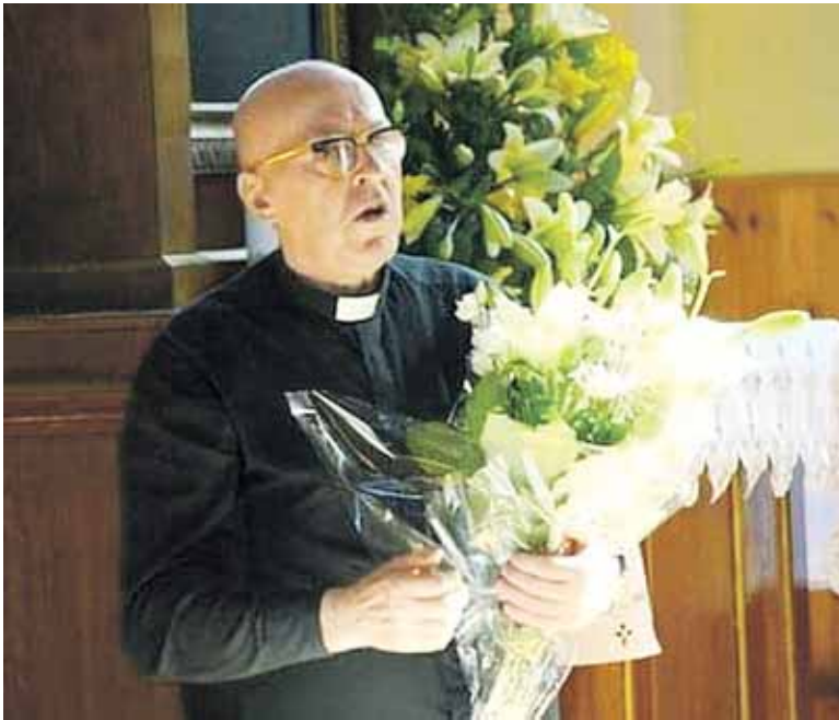
Kunigas emeritas Steponas Tunaitis