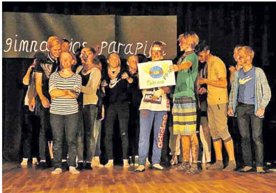
4c klasės mokiniai gimnazijos pirmųjų krikštynose