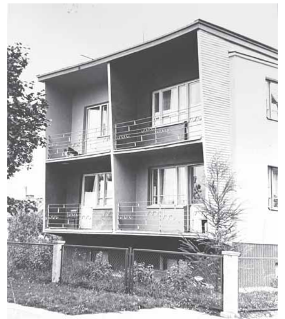
4-ių butų gvy. namas M.K. Čiurlionio g. 24