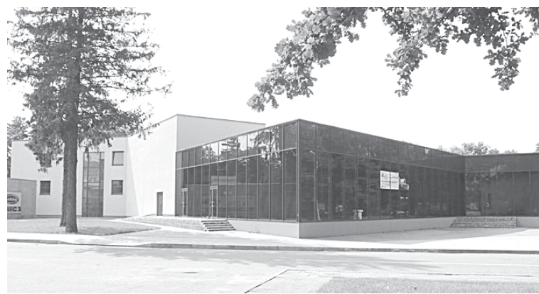
Buvusi „Ūlos“ kultūros centro salė

Savivaldybės teigimu, preliminariai planuojama, kad „Lidl“ statyba prasidės šių metų rudenį, o duris parduotuvė atvers iki kitų