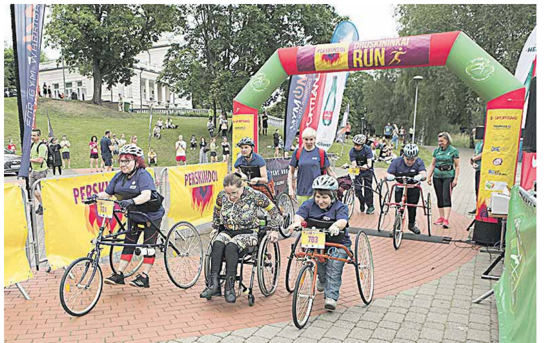
Neįgalieji startavo su triračiais