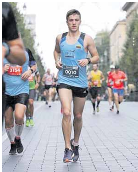
Domas bėgimo maratonuose

tuvių istorijas Kazachstane papasakoti tūkstančiams mokinių Lietuvoje. Šiais metais dėl karantino ir saugumo aplinkybių komanda nevyks į ekspediciją, tačiau tikiu, kad tai vėl tik dar labiau sustiprins projektą ir pavers jį visapusiškesniu. Lietuvoje taip pat yra daug neatrastų vietų ir žmonių, kurie saugo istoriją ateities kartoms.