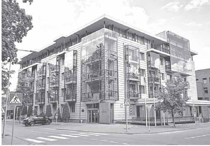
Buvusio „Turisto“ viešbučio kavinėje įkurtas „Šaltinio“ jaunimo klubas kiekvieną mėnesį rengdavo įdomius susitikimus