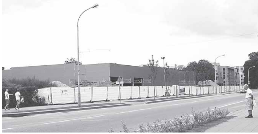
Bekylanti „Maxima“ M.K.Čiurlionio gatvėje