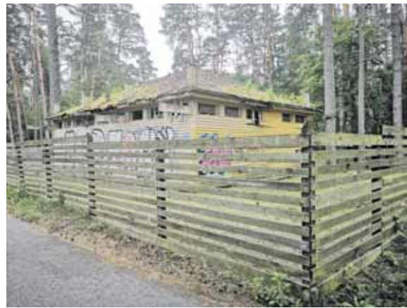
Vietoje buvusios vasaros kavinukės suprojektuotas 2 aukštų poilsinis pastatas

nakvynės apartamentais ir kitomis poilsio paslaugomis statyba privačiomis lėšomis 0,1199 ha privataus sklypo plote. „Taigi nežinia, kokie reikalavimai keliami šiam projektui, ar kaip maitinimo, ar kaip apgyvendinimo įstaigai? – klausia kurorto senbuvis. – Apskritai, ar parko rekreacinėje teritorijoje, kuri kažkada berods buvo botaniniu draustiniu, galima komercinės paskirties objektų statyba?“. „Druskonio“ patikslinimu, netoliese šių vietų tėra tik Meilės salos botaninis draustinis.