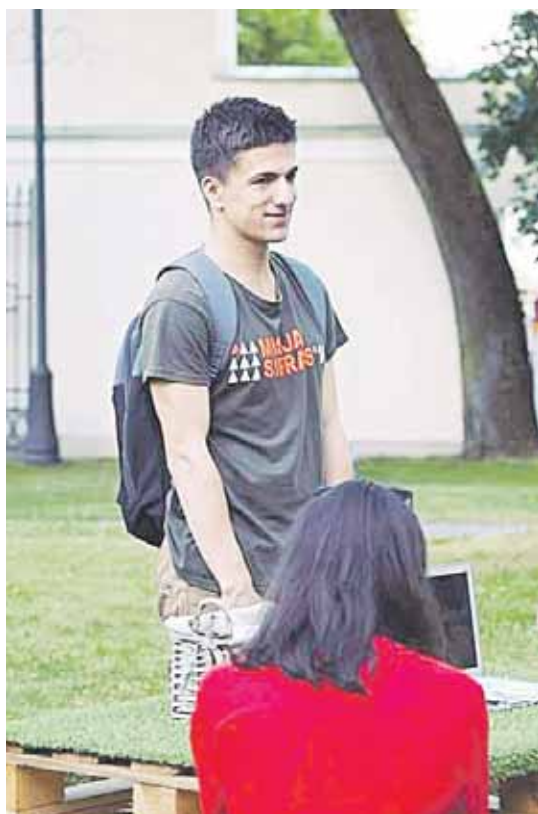
Anot Domo, „Misija Sibiras“ veikla tęsiasi